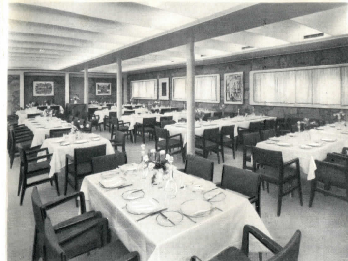
SEGUNDA CLASE - Salón comedor

Llega después la hora del té, amenizada por una selecta orquesta y la hora del cine. Luego de la cena, otras atracciones se ofrecen a los pasajeros: la música, bailes, juegos en simpáticas compañías y durante toda la travesía diversiones y espectáculos siempre nuevos concurren a hacer del viaje unas inolvidables vacaciones.