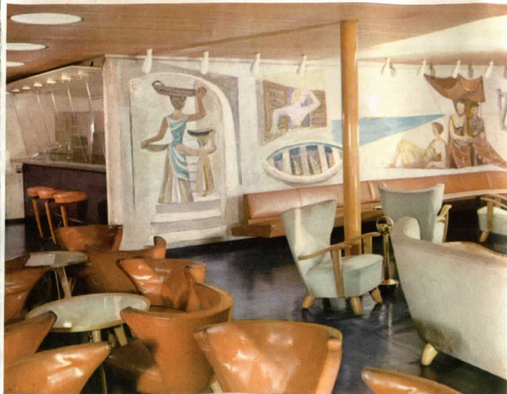
SEGUNDA CLASE - Sala para fumadores y Bar

escuela triestina que han fijado un estilo bien preciso e inconfundible en esta nave, donde la vista y el buen gusto quedan constantemente y en elevada medida satisfechos.