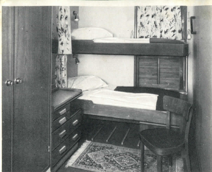
SEGUNDA CLASE - Camarote de dos plazas