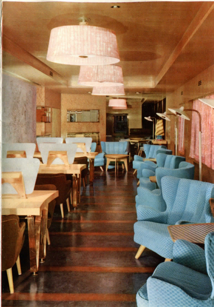
PRIMERA CLASE - Sala de lectura y de escritura

Hay también quienes aprovechan esta hora para realizar un poco de « footing » o cura de sol y quienes son atraídos por la biblioteca o sala de escritura.