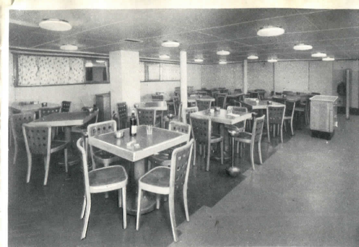
TERCERA CLASE - Bar