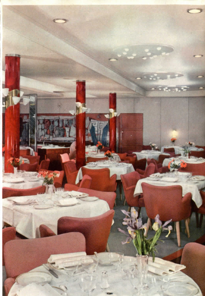
PRIMERA CLASE - Salón comedor

A la amplitud de los ambientes sociales, de las cubiertas, de las « piscinas », se agrega luego la característica de una esquisita decoración, casi una galería flotante de arte, fruto de la contribución, en su mayoría de escultores y pintores de la